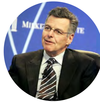
마이런 솔즈 (Myron Scholes)